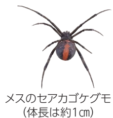
メスのセアカゴケグモ (体長は約1cm)

市内でセアカゴケグモが見つかっています。強い毒がありますが、攻撃性はなく、素手で触らなければかまれる心配はありません。このグモは側溝やブロックのくぼみ、室外機の裏などに生息していることが多いです。屋外清掃のときは長袖や軍手、靴を着用し、見つけたときは殺虫剤をかけて駆除してください。