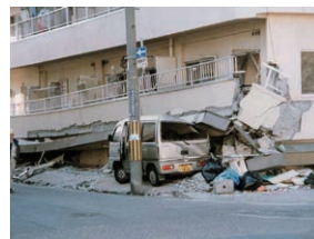
阪神大震災で倒壊したマンション