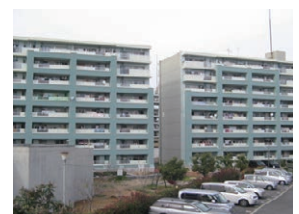
耐震化工事を 実施したマンション