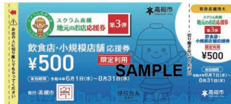
飲食店・小規模店舗応援券