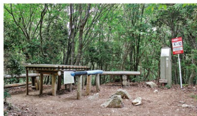
▲釈迦岳(三等三角点)