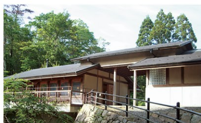
▲大原野森林公園 森の案内所 TEL:075-333-8229