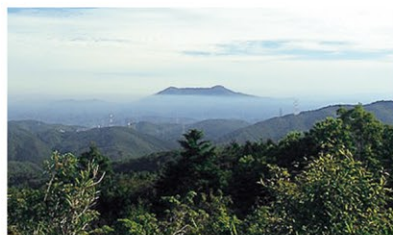
▲ポンポン山から愛宕山を望む