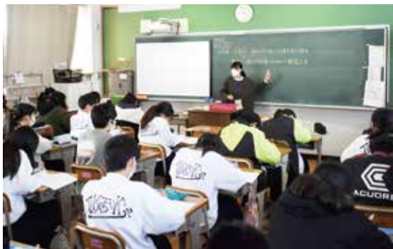
▲35人学級編制を段階的に実施する中学校

教育指導課長 令和2年度の生徒数を基準とした学級数で試算すると、28学級の増加となります。また、人件費は、年間1人約550万円、合計1億5400