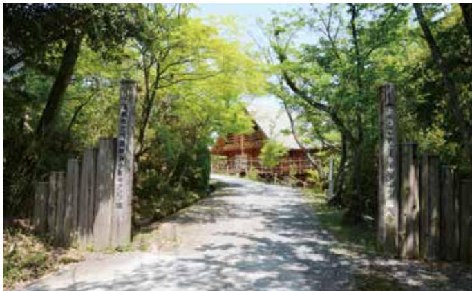
▲都市近郊型キャンプ場としての活用も期待される青少年キャンプ場

市長 文化振興事業団とみどりスポーツ振興事業団については、令和4年4月を目標に事業統合に取り組み、文化・スポーツに関する事業のより一層総合的な推進を目指す