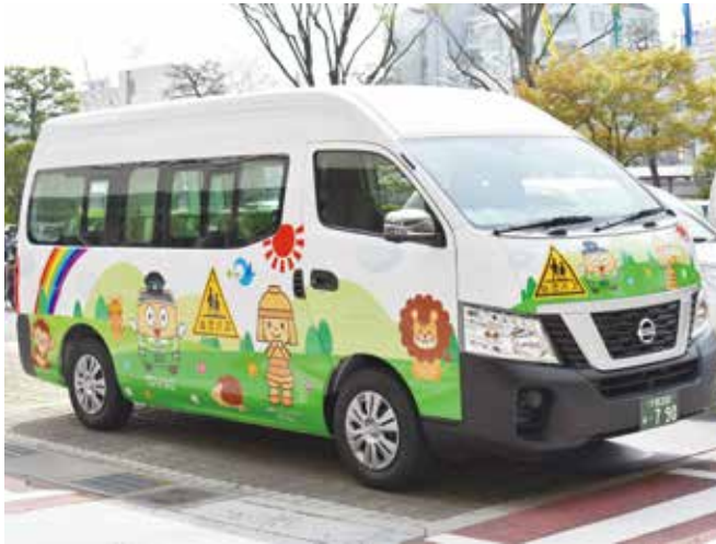
▲送迎保育ステーション事業で使用するバス

保育所入所等の状況として希望する認可保育施設に入所できない子どもがいる中、定員に空きがある認可施設もある状況から、市内の保育資源を効果的に活用し、少しでも多くの子どもが認可施設に入れるよう実施するものです。