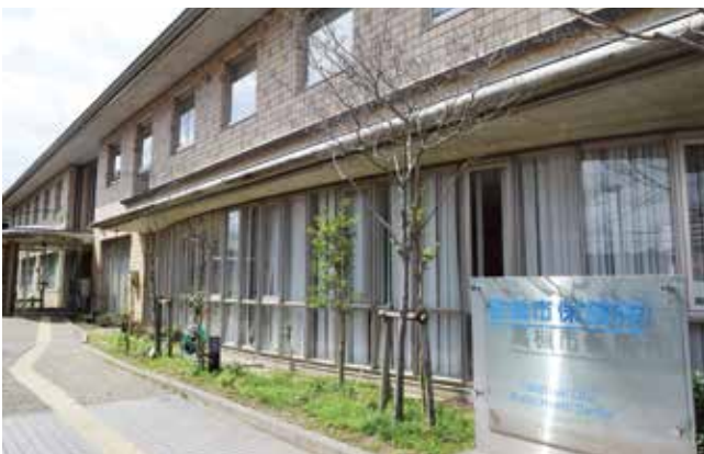
▲一層の体制強化が求められる保健所

また、健康危機管理事象への対応は専門性が必要であるため、保健師等の全庁的な応援体制を継続し、多くの職員に感染症対応を経験させることで、専門職員の資質向上を図ります。引き続き、国や大阪府の動向を注視し、必要な要望を行います。