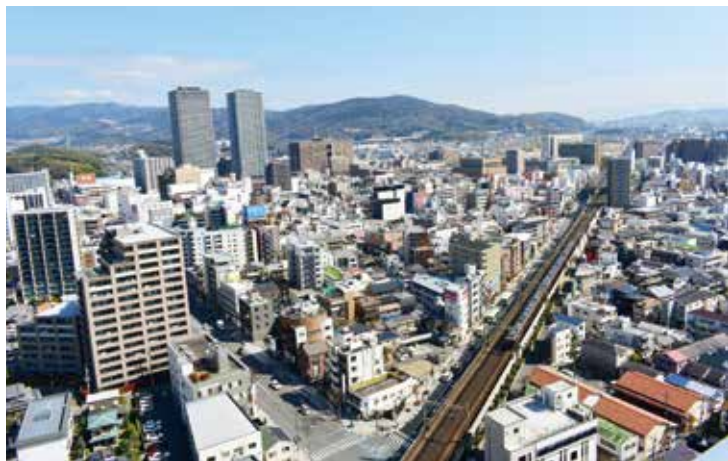
▲みらい創生の実現のため、新たな財源の確保に取り組む高槻市