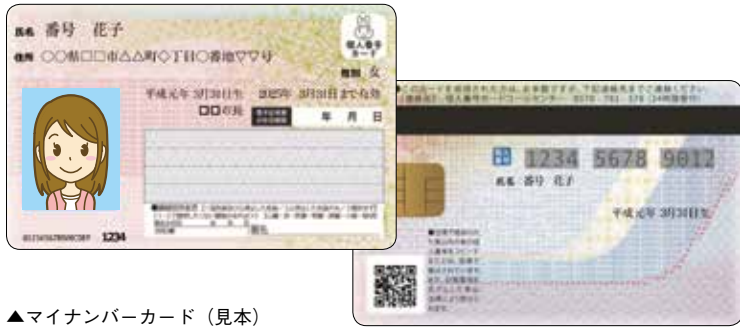
▲マイナンバーカード（見本）

すい環境を整えます。 行政サービスのデジタル化については、総務省が策定した自治体DX推進計画に基づき、市民の利便性向上が見込まれる、子育てや介護等の手続きからマイナンバーカードを用いた行政手続きのオンライン化を推進していきます。