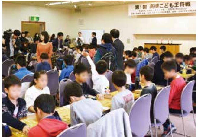
▲将棋を活用したにぎわいの創出等の積極的な施策が期待される

活動を実施してきました。関西将棋会館の本市への移転は、本市の歴史に残る大きな出来事であり、心から歓迎するものです。今後は、引き続き日本将棋連盟との緊密な連携の下、将棋を活用したにぎわいの創出等に積極的に取り組みます。