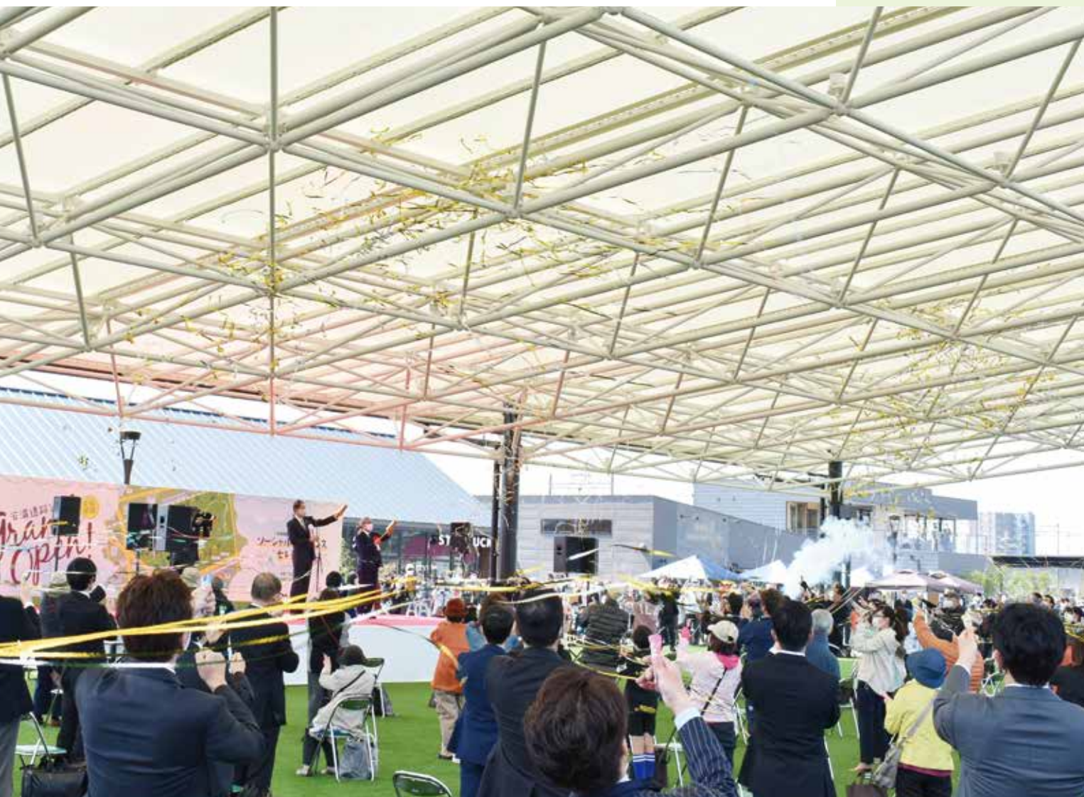
全面開園記念セレモニー