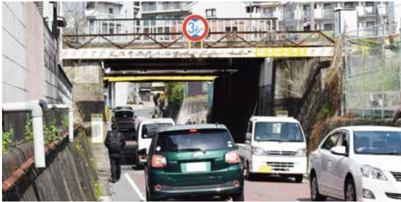
▲安全対策が求められるJR摂津富田駅周辺のアンダー部

等多くの地域課題が解決できるため、鉄道高架化勉強会を開催し、検討を進めています。また、阪急京都線も併せて高架化することで、阪急踏切の課題解決や市街地の一体化による地域の発展等も期待できるため、JRはもとより阪急の高架化についても大阪府に事業化の検討を要望します。