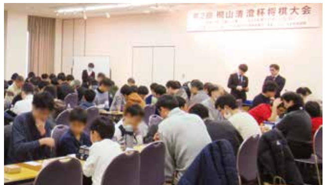
▲桐山清澄杯将棋大会など様々な取り組みを通じて将棋文化の振興を図っている

本将棋連盟と自治体として全国初の包括連携協定を締結し、様々な取り組みを通じて将棋文化の振興を図ってきました。そのような中、令和元年8月、大阪市内にある関西将棋会館の本市への移転を提案したところ、令和3年2月、日本将棋連盟が移転を決定されたものです。今後は、移転の実現に向け支援し、引き続き日本将棋連盟と連携し、将棋文化の振興等に積極的に取り組みます。