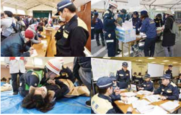
▲危機事象に対し、より迅速かつ的確に対応することが求められる危機管理室（イメージ）