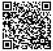
▲本会議の録画映像