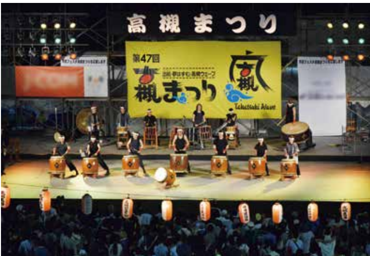
▲今後の開催継続の支援が求められる高槻まつり（平成29年8月撮影）

つりの開催継続を支援するため、2年度と同様に、高槻まつり振興会の運営に対する補助を行うものです。 議員 高槻を代表するイベントである高槻まつりの継続を図るべくしっかりと補助してほしい。そのためにも、補助金の使途が適正かを今後もチェックしつつ、力強い後押しをしてほしい。