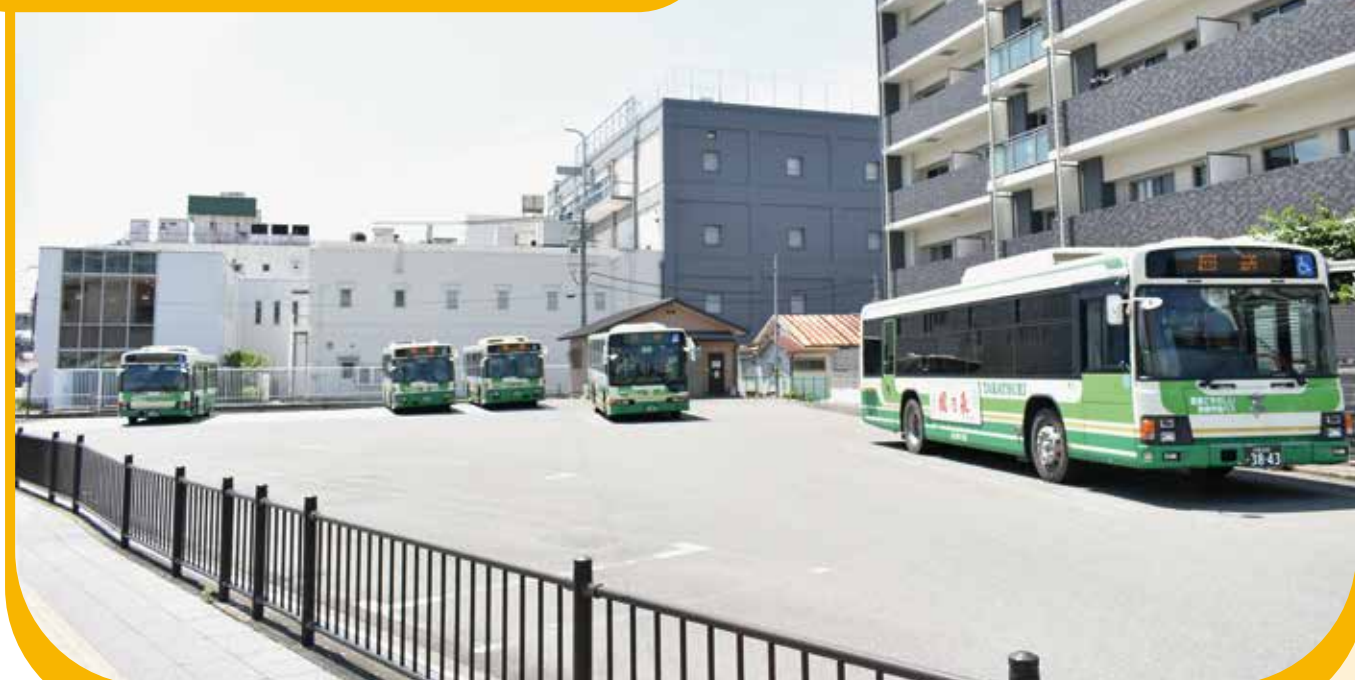
関西将棋会館の建設予定地、市営バスのJR高槻西滞留所