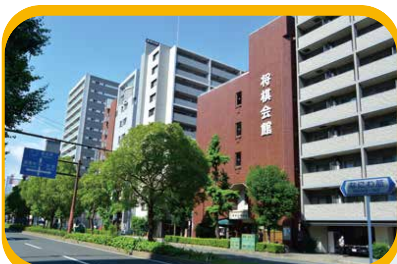
現在の関西将棋会館 (大阪市福島区)