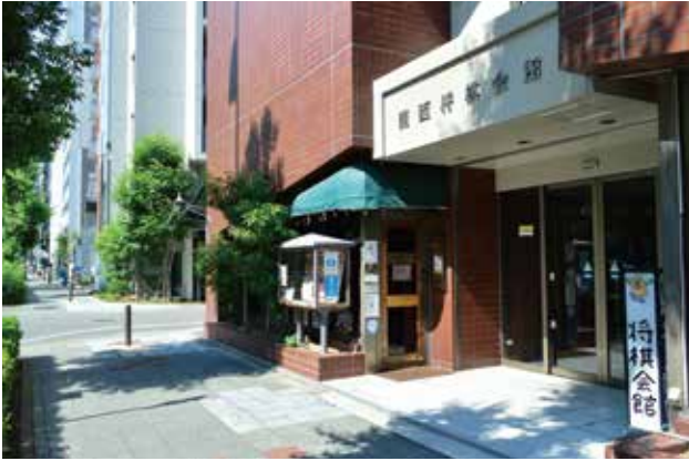
▲高槻市に移転予定の関西将棋会館

観光シティセールス課長 関西将棋会館の誘致時に、高い交通便利便性や固定資産税等の減免のほか、ふるさと納税制度を活用した寄附金募集の協力についても提案し、それらを高く評価されたことな