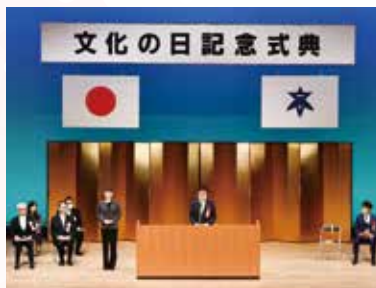
文化の日記念式典

議長は、会議において議事を整理し、議会の事務を処理しています。そのほかにも、議会を代表し、様々な議長公務を行っています。