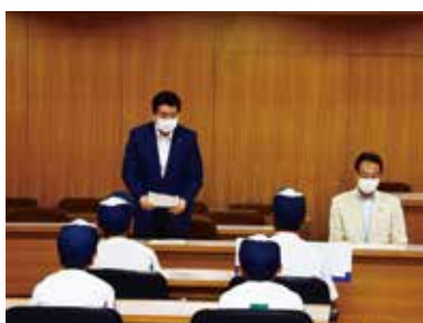
高槻リトルリーグ全国大会出場 表敬訪問