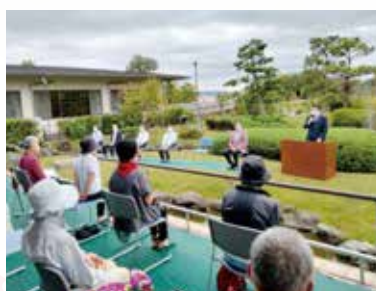
郡家すこやかテラス リニューアルイベント