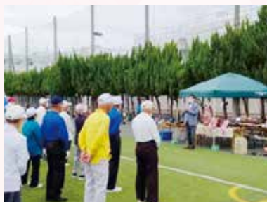
第42回市長杯ゲートボール大会