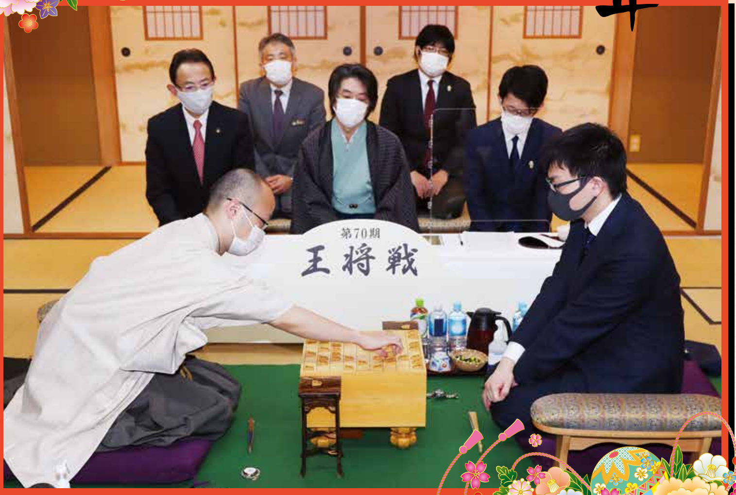
昨年開催された王将戦の様子

今年も高槻市において、将棋8大タイトル戦の一つである王将戦を、1月22日(土)、23日(日)にわたり開催予定です。