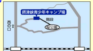
市営バス、JR高槻駅から「関西大学」行、JR摂津富田駅から「関西大学」「萩谷」「萩谷総合公園」行に乗り、「西の口」下車、東へ徒歩すぐ。