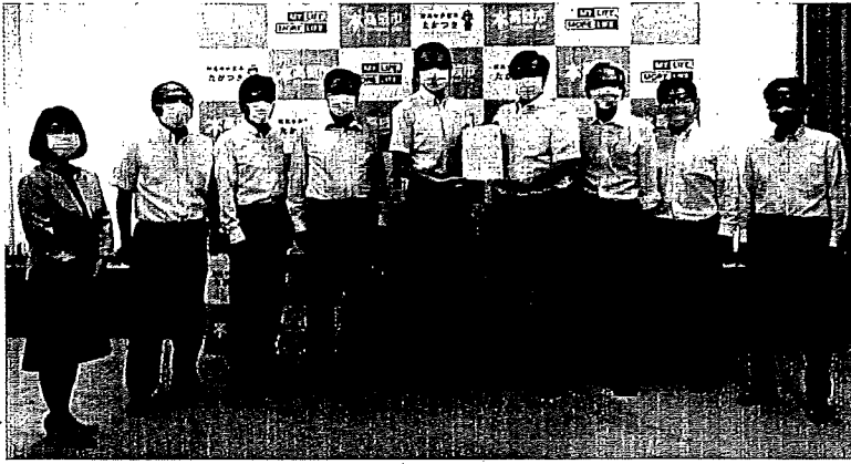
濱田剛史市長に緊急要望する高槻市公明党議員団

新型コロナウイルス感染症によりお亡くなりになられた方々に心より哀悼の意を表しますとともに感染された方々にお見舞いを申し上げます。