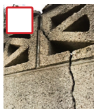
築後30年以上 たっている、または 風化している