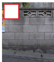
透かしブロックが 連続して、または 多く使用されている