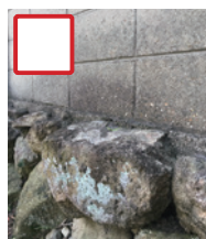
石垣などの上に 建っている (鉄筋が石垣に入らない)