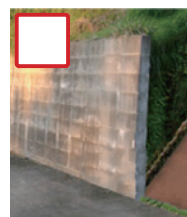
土留めに使っている (後ろから土の重量が かかっている)