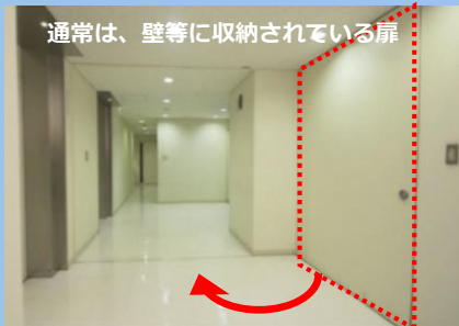
通常は、壁等に収納されている扉