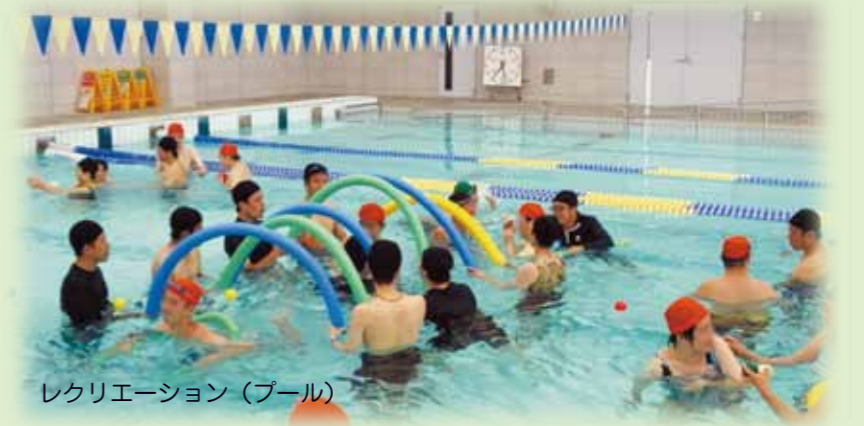
レクリエーション(プール)