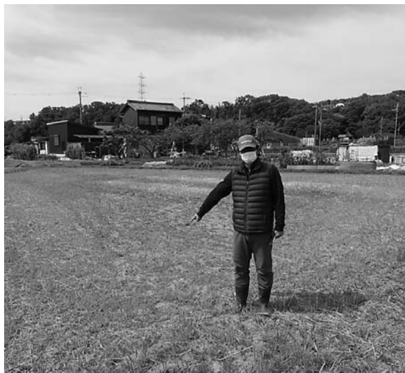
農地の耕作状況について調査をする委員

また、下水河川企画課及び下水河川事業課の農業関連（農業基盤の整備事業及び河川・水路