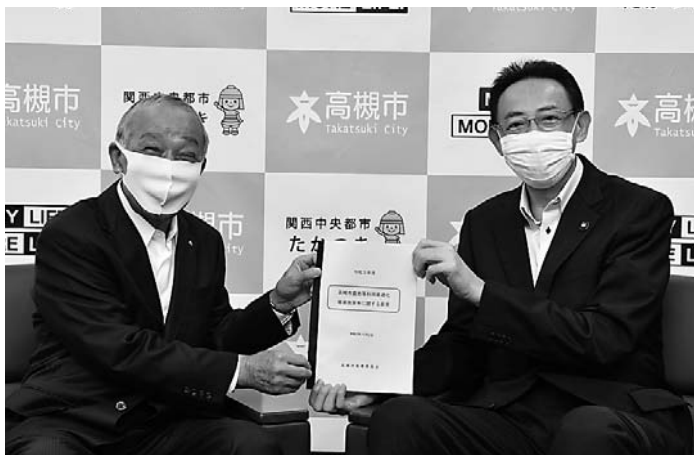
市長(右)と意見を手交する橋長会長(左)

するため、良好な営農環境の整備をはじめとした、農業関連予算の充実を求めました。これを受け、今年度の本市農林緑政課の農業関係（農業振興事業、地産地消・食育推進事業、市民協働・交流推進事業、営農推進事業、農業基盤整備に係る事業等）の総予算額は、6,775万5千円となります。その内訳として、有害鳥獣対策や認定農業者支援などの農業振興事業の625万7千円、学校給食や地元産農産物及び特産品支援などの地産地消・食育推進事業に375万円、農林業祭や農地の多面的機能の維持を支持するなどの市民協働・交流推進事業の1,066万7千円となっています。そのほか、経営所得安定対策などの営農推進事業は832万5千円、農道整備などの農業基盤の整備及び保全事業は3,875万6千円となります。また、下水河川企画課及び下水河川事業課の農業関連（農業基盤の整備事業及び河川・水路