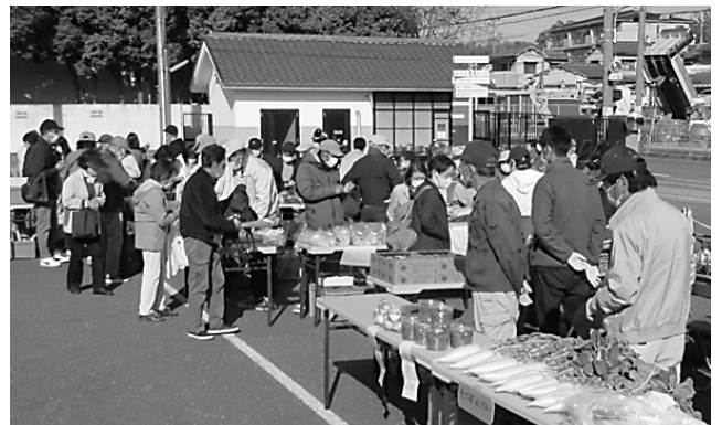
4月に今年度初めて開催された朝市