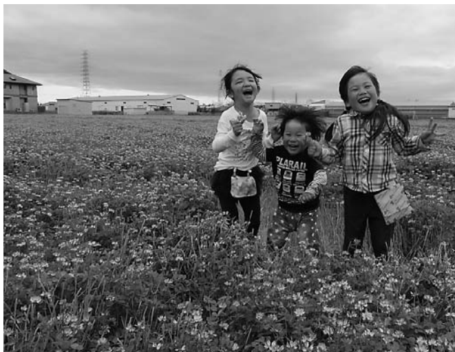
レンゲ畑で元気いっぱい楽しむ子どもたち

今年も三島江地区で薄紫色やピンクのレンゲが田園一帯に咲き、人々の目を楽しませました。