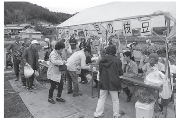
地産地消の一環として行われる原の黒枝豆イベント

と進んでいる。本市の農業は「都市農業振興基本法」に定められ、まきしく「市街地及び周辺の