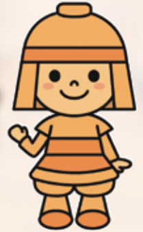
高槻市マスコットキャラクター 「はにたん」