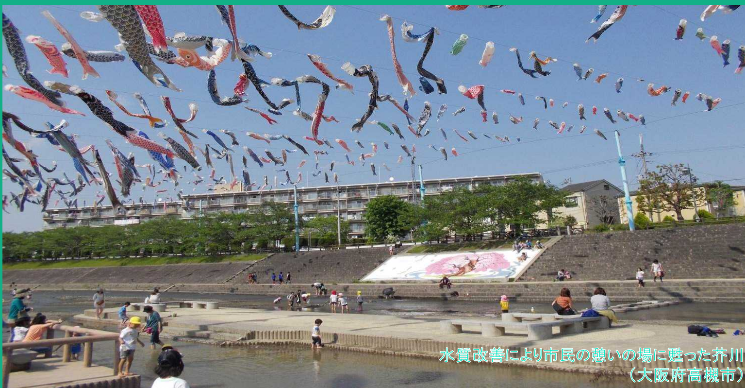
水質改善により市民の憩いの場に甦った芥川 (大阪府高槻市)