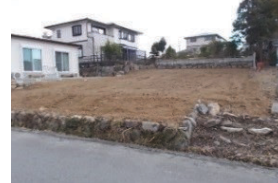
三重県津市(土地) 譲渡額約270万円