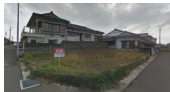
鹿児島県いちき串木野市(土地) 譲渡額約350万円