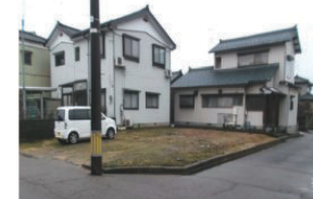
新潟県燕市(土地) 譲渡額約350万円