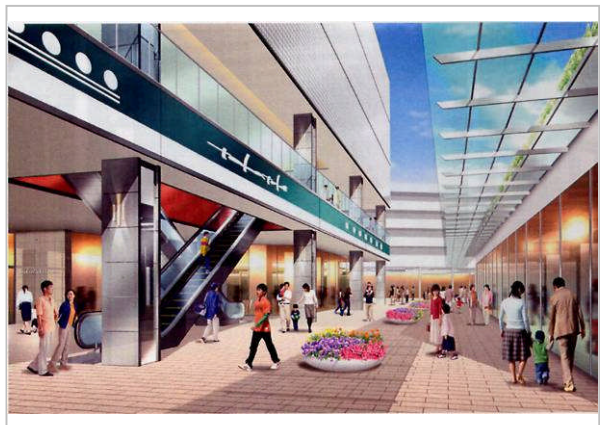
■公開デッキイメージ図