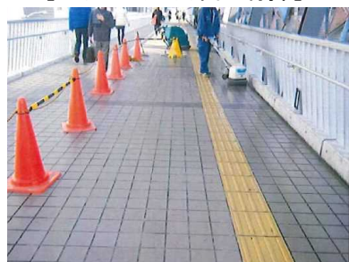
[公共デッキ床面清掃]