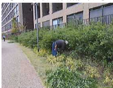
[公園植栽(薬剤散布)]