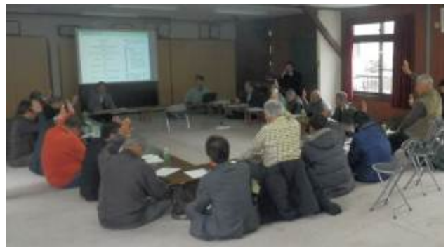
総会での議決の様子

皆様には今後とも当協議会の活動にふるってご参加いただきますようお願いいたします。