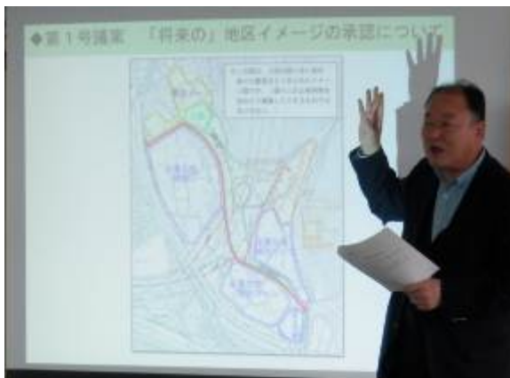
第1号議案「将来の地区イメージ」の説明

さて、今回の議事は、第1号議案、第2号議案ともに、賛成多数で議案書どおり可決されることとなりました（詳しくは下表をご覧ください。）。