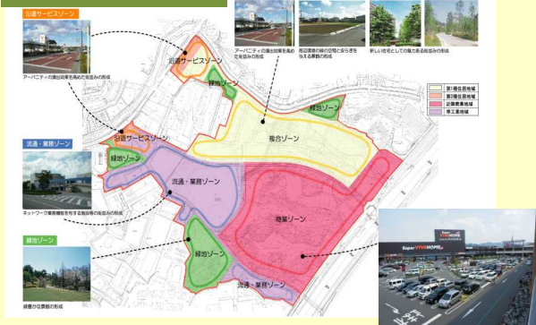
視察先のゾーニング図

第二京阪沿道まちづくりへの視察会を開催。寝屋川市での取組事例を視察し、計画的に保全された農地や新たな土地利用について直接見る事ができました。