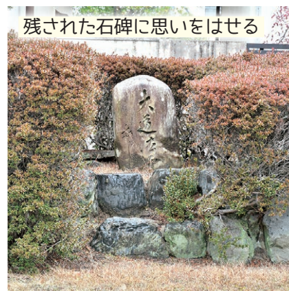
残された石碑に思いをはせる

この地にはかつて高さ約1.2m、直径約12mの塚があり、巨大な足跡のある石があったが、戦後まもなく失われたという。現存する「大道法師あし跡」碑は、文化8(1811)年に再建されたもの。