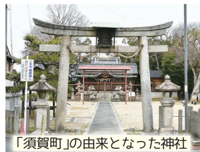
「須賀町」の由来となった神社