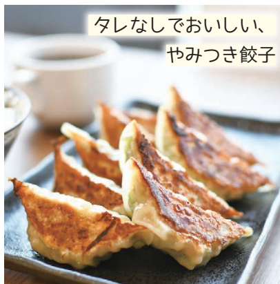
タレなしでおいしい、 やみつぎ餃子

高槻産の食材を多く使用している、手作り餃子専門店。あんがたっぷり入った餃子を一口食べると、肉汁が口いっぱいに広がりご飯が進む。定食の餃子は数種類の中から組み合わせることもできる。