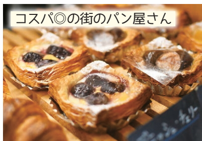
コスパ◎の街のパン屋さん

スイーツ系や総菜パンなど品ぞろえが豊富でリーズナブルなのがうれしい、地元で人気のパン屋さん。モーニングやランチ、おやつなどどんなシーンにも合う多彩なパンを一度味わってみて。