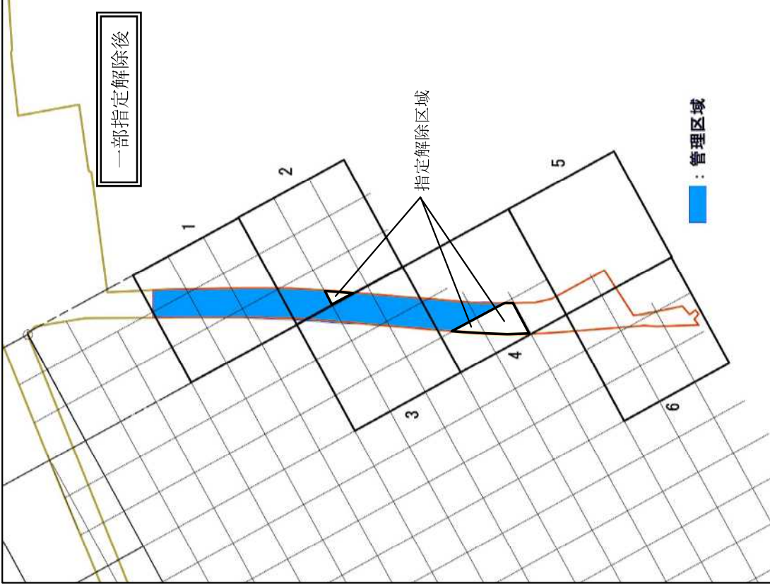
図 2. 一部指定解除後の管理区域