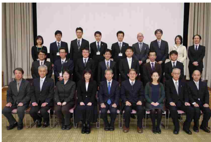
高槻市総合交通戦略検討協議会の関係者

どうぞ、これからの取組について市民の皆様が主体的な関わりを持っていただきますようお願いを申し上げます。