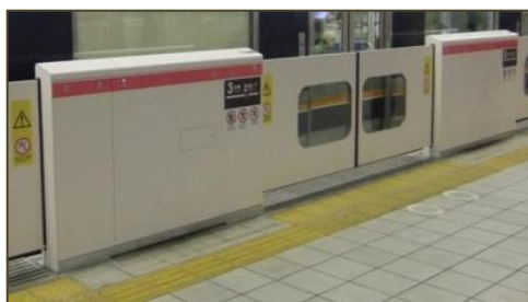
2・5 番線（一重引戸式）のイメージ