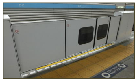
3・4 番線（二重引戸式）のイメージ