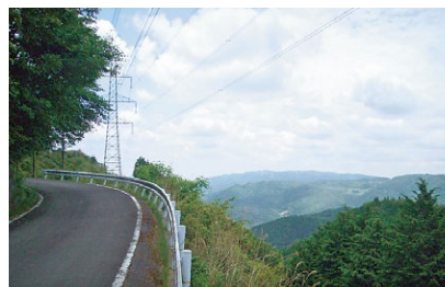
▲ 鉄塔付近から茨木方面を望む