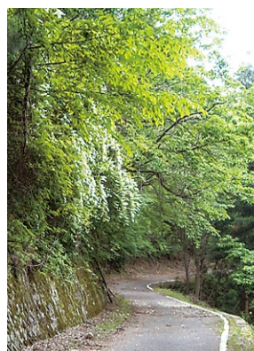
▲ 「うのはな」が咲いています。 (見頃5月～6月)