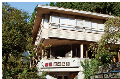
▲ 高槻森林観光センター(榎田温泉) 家族連れで楽しめる森林レクリエーションセンター。しいたけ狩り、木工クラフト、地元食材を主に使ったバーベキューなどの食事も楽しめます。宿泊・温泉施設もあります。 TEL:072-688-9400