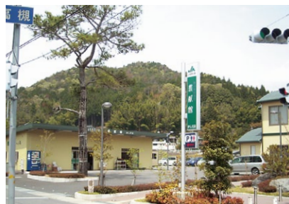
▲ 農風館(かしだ店) 地元産の米や味噌、新鮮野菜、農産加工品などが買えます TEL:072-688-9601