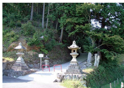
▲ 大神宮社 社殿は1754年に修築したもの。10月に秋祭、12月に新嘗祭などが行われます。境内には本宮のほか、巖島神社や弁財天宮などもあります。