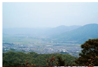
▲ すぐそこに 亀岡市街が 見えます