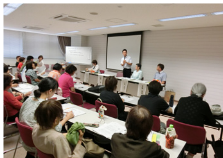
シンポジウムも大盛況！！