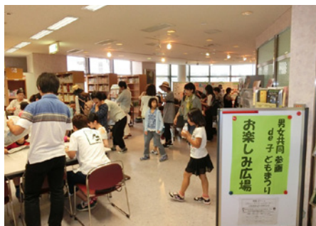
子どもたちも大喜びのお楽しみ広場