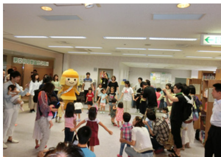
みんなと一緒に「テケテケはにたん体操！」

初めての試みではありましたが、今までにはないとても活気あるイベントとなり、大盛況のうちに終わりました。