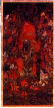
大鳴山七宝瀧寺の行者の滝と 「不動明王二童子四十八使者図」 (大阪府指定文化財、七宝瀧寺蔵)