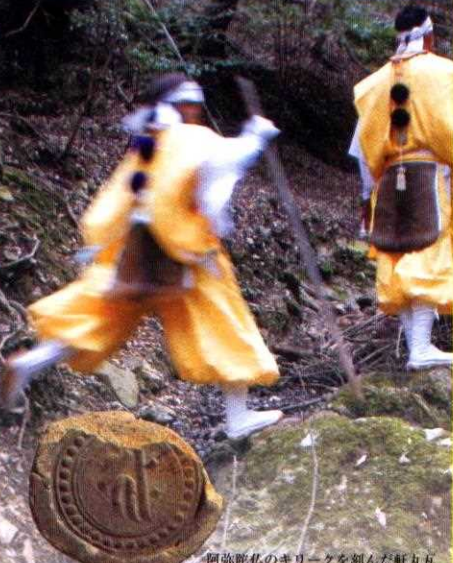
阿弥陀仏のキリクを刻んだ軒丸瓦 (往生院六萬寺蔵)