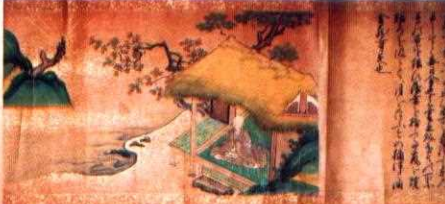
金龍寺・千観の姿を描く愛宕念仏寺縁起絵巻(愛宕念仏寺蔵) ※会期中、場面の巻替えがあります