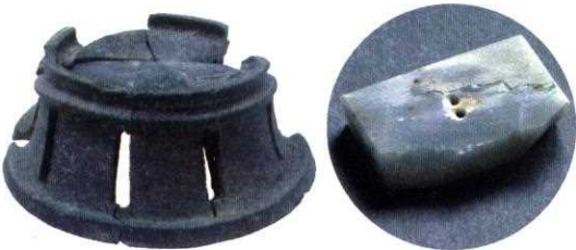
左：成合遺跡出土の円面硯((公財)大阪府文化財センター蔵) 右：金龍寺旧境内跡出土の石帯巡方((公財)大阪府文化財センター蔵)

古代以来、人びとは神の宿る山に籠もって信仰を深め、大阪では北摂山地の神峯山と、南東部の葛城山系に山林修行の場が営まれてきました。また、山から西方極楽浄土を想う念仏聖が、高槻の安満山・金龍寺と生駒山中腹の河内往生院に隠棲しました。現在もなお、これらの山中に佇む古刹が、修験と西方浄土の信仰ゆかりの名宝と文化を伝えていきます。本展では、大阪の山と信仰を取り上げ、仏教美術・文献・考古資料などから、その歴史を紹介し、山々に広がる宗教文化を探ります。