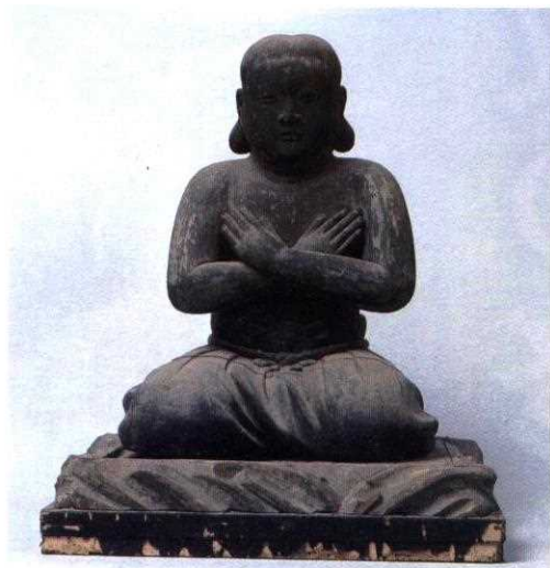
開成皇子像(神峯山寺蔵)