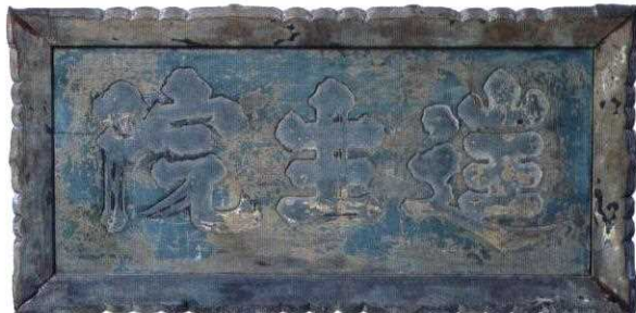
扁額「往生院」(往生院六萬寺蔵)