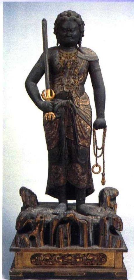
不動明王立像(高槻市指定文化財、本山寺蔵)