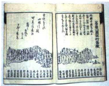
『葛嶺雑記』(七宝瀧寺蔵)