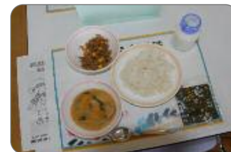
「高槻農産物の日」の学校給食