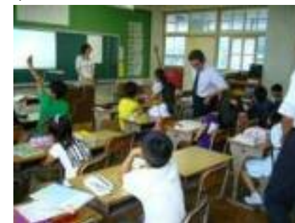
小学校の授業風景