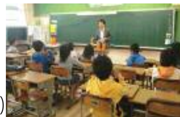
児童が安心して学べるよう 学校園の耐震化を促進