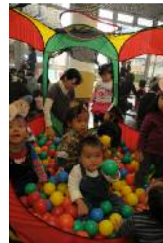
カンガルーの森で楽しむ親子