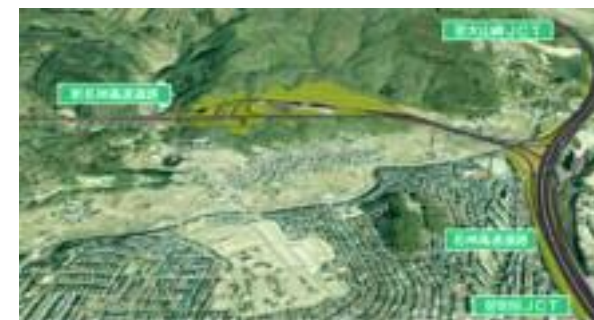
新名神高速道路(イメージ図)