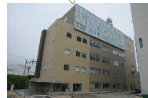
新消防本部庁舎 (6月から指令業務を開始)