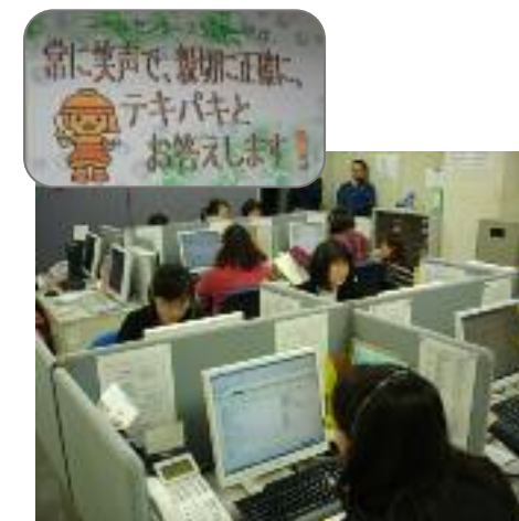
高槻市コールセンター

北部地域の行政サービスコーナー設置に向けた取組 パスポートセンターの設置に向けた検討 債権管理課(新設部署)による税外債権の適正管理 市税の電話催告を充実