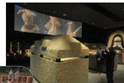
いましろ 大王の杜