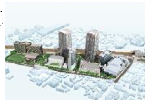
JR高槻駅北東地区(完成イメージ)