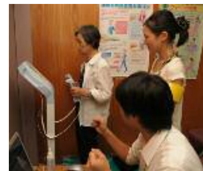
健康づくり(健康フェア)