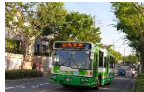
市民に幅広く親しまれている市営バス