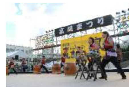
市民フェスタ高槻まつり