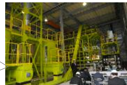
バイオコークスのプラント